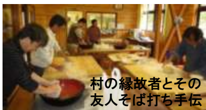
村の縁故者とその友人そば打ち手伝