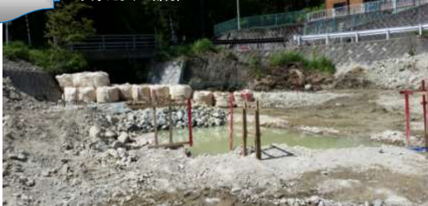
橋台の基礎を作るため硬い岩盤が掘り下げられている(写真中央水たまりの部分)