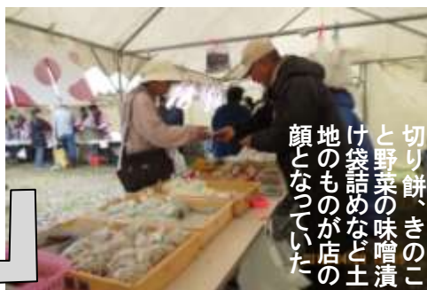
切り餅、きのこ と野菜の味噌漬 け袋詰めなど土 地のものが店の 顔となっていた