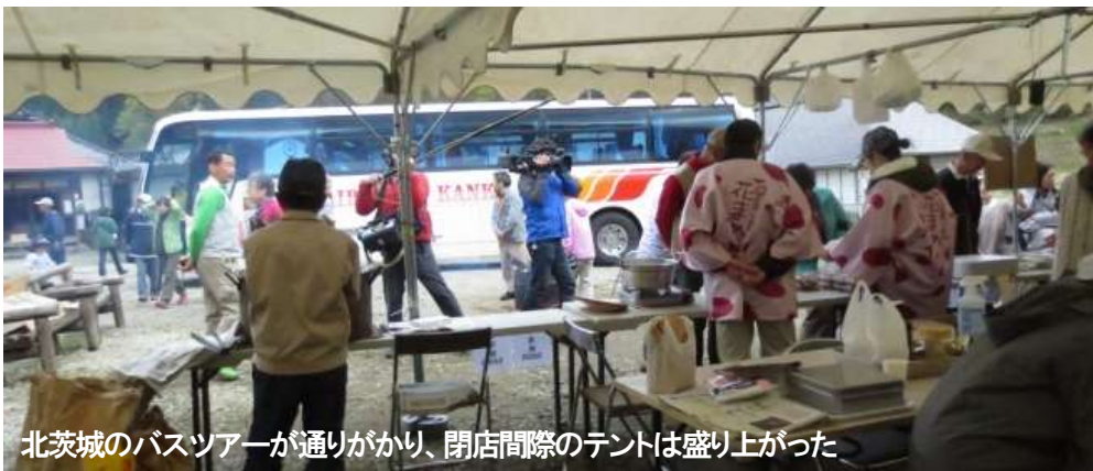
北茨城のバスツアーが通りがかり、閉店間際のテントは盛り上がった

町観光協会・観光公社、町職員はじめ村外からの縁故者のお手伝いをいただき、観光客にも元気づけられた桜まつり。おもてなしのメインは臼で餅つき。手打ちそば、つきたて餅、玉こんにゃく、イワナ塩焼はじめ、切り干し大根、乾燥ゼンマイ、花豆、パイなどほか、木地工房の製品にも人気が集まりました。