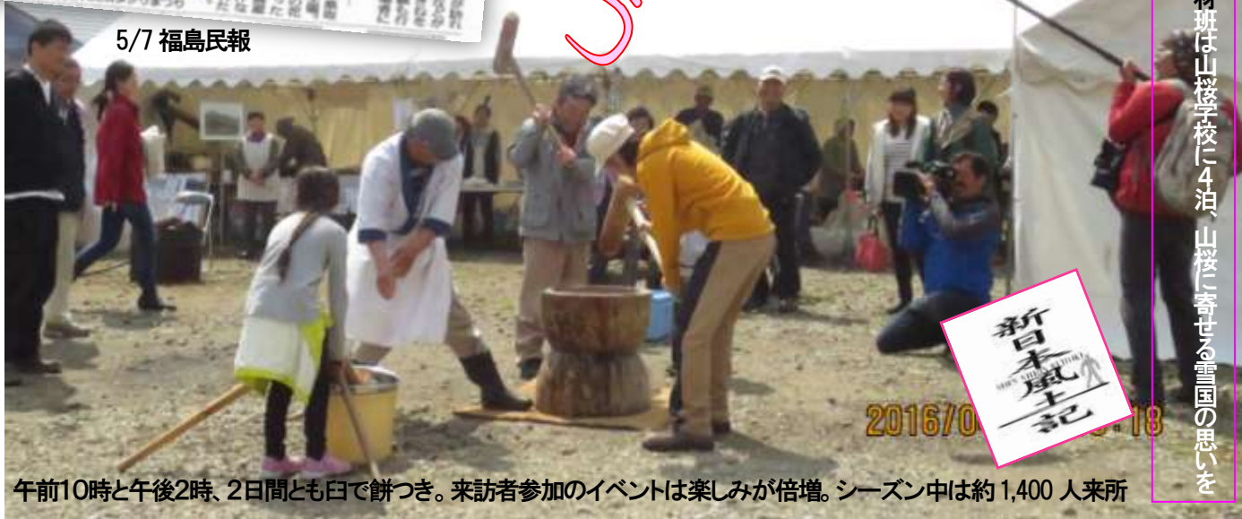
午前10時と午後2時、2日間とも臼で餅つき。来訪者参加のイベントは楽しみが倍增。シーズン中は約1,400人來所

NHK新日本風土記の取材班は山桜学校に4泊、山桜に寄せる雪国の思いを掘り下げようと密着取材