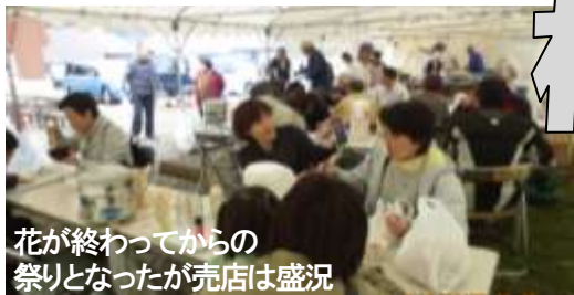
花が終わってからの祭りとなったが売店は盛況