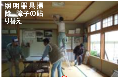
照明器具掃除、障子の貼り替え