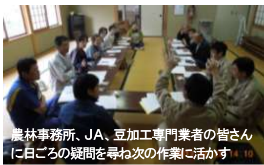
農林事務所、JA、豆加工専門業者の皆さんに日ごろの疑問を尋ね次の作業に活かす

花豆パイに使用するあんはB級の花豆を長時間浸水させむだなく使うことなどこだわりを持って商品化にこぎつけたことや、ネキリムシ防除の殺虫剤はダイアジノン5粒剤が有効であることなど勉強した花豆講習会は、五月二十八日開催されました。定植が終わったこの時期、農業を使った場合はその記録を株間畦間など栽培作業の記録をメモしておく農業検査などにもしつかりと安心感を公表できるようにしていくにしました。販売準備中の花豆パイの裏ラベルが最終的に決まりました。販売者は戸赤村づくり実行委員会、住所氏名は区長、連絡先の電話番号は山桜事務局となりました。販売される製品の花豆パイを皆で試食しました。