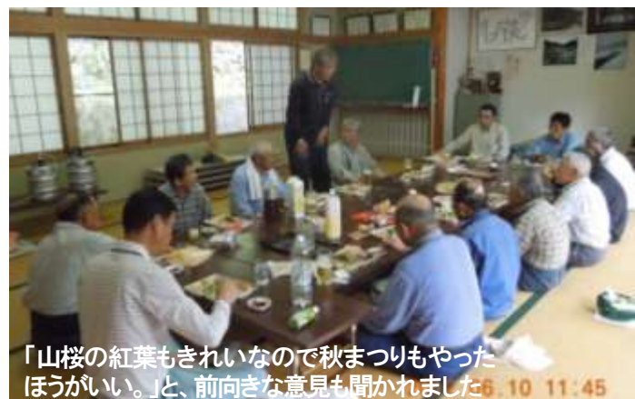
「山桜の紅葉もきれいなので秋まつりもやったほうがいい。」と、前向きな意見も聞かれました6.10 11:45

手際良く作業を進め懇親会で近況を語り合い、地域の行く末を見つめ直す機会ともなった集会所所掃除は、6月第2日曜日予定通り行われました。同時に山桜祭りの決算も行われ、個人販売額、出役謝礼、実行委員会の収益など少ないながらもイベントをやればそれなりに楽しいし元気が出ることを改めて確かめあうことができました。