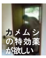
カメムシの特効薬が欲しい