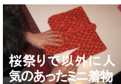
桜祭り以外に人気のあったミニ着物の

冬も楽しいものです。趣味の縫いものでできる時間がたつぷりあり、布と針でミニ着物など二着物などどこかチクチク桜祭りで思ったりしながら、