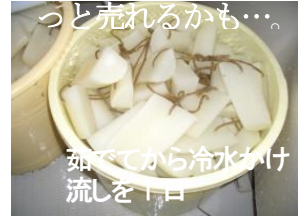
茹でてから冷水がけ流しを1日

凍み大根がのれんのように各家の軒下で作られています。食べ方を書いて試食を出すと桜祭りでもっと売れるかも…。