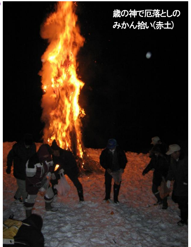
歳神火で厄落としのみかん拾い(赤土)

【木地の学習No.3】会津地方では遅くとも中世のこのころから木地師が存在していたことは間違いないが、蒲生氏郷氏により漆器産業がクローズアップされてくるこの時期が会津漆器の一大転換期であった。現代会津漆器の基を築いたのは蒲生氏郷であるといっても過言ではない。…ろくろを使用して椀、盆、皿等の木製品を制作する職業者を古代ではろくろ工、中世にはろくろ師とよび、近世に入っては木地師、木地屋等とも言い表わされて、その後木地師とも称されてきた…。木地師の住んでいたところが、後に「木地小屋」という地名になっている例は会津地方に多くあるが、猪苗代町木地小屋はその代表的なものである。普通は親村に対しての端村や小名であるが、この小屋は「木地小屋村」という一村を形成している。…木地小屋村は山から山への「飛」を止め、田を開き早くから農民化の道を進んでゆくことになる。初期のころは木地業を主として農業を副とし、時間を経るに従って農が主となり、やがて木地産業を廃業してしまった。(奥会津地方歴史民俗資料館「木地語り」より) (つづく)