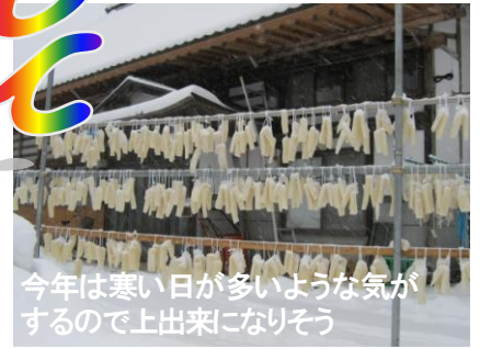
今年は寒い日が多いような気がするので上出来になりそう