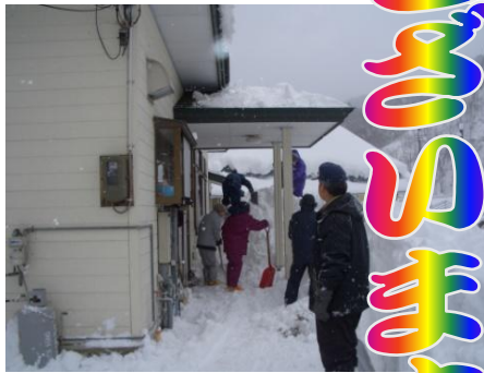
下ろした後のかたづけも大変な作業

一月二十三日約八割の世帯が協力し、戸赤集会所と消防屯所の屋根の雪下ろしが行われました。高齢者世帯の中には他県で暮らしている子供などを呼び寄せ出役したケースもありました。集落内の各坪でもこれと前後してお宮などの雪下ろしが行われました。